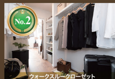
ウォークスルークローゼット