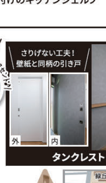
タンクレストイレ