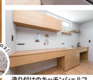
造り付けのキッチンシェルフ