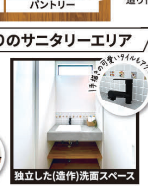
独立した(造作)洗面スペース