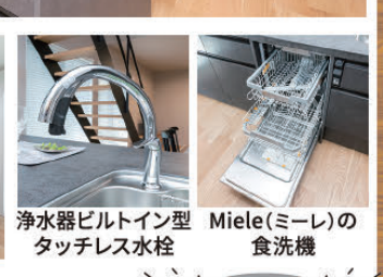
浄水器ビルトイン型 タッチレス水栓 Miele(ミーレ)の食洗機