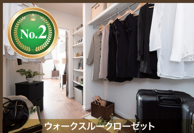
ウォークスルークローゼット